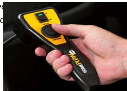
Afbeelding 3: Standaard afstandbediening DrivePro