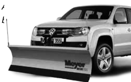
Afbeelding 2: Nite Saber Verlichting.