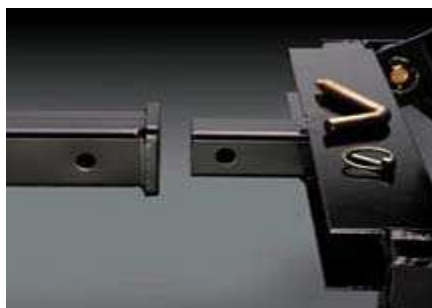
Afbeelding 4: De 2" receiver koppeling, licht in gewicht.