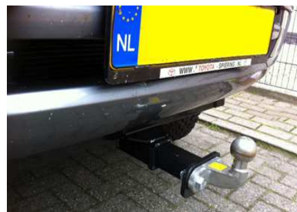
Afbeelding 5: De 2" receiver koppeling kan ook gebruikt worden als trekhaak aan de voorzijde (optie)

Prijzen zijn ex. BTW en onder voorbehoud prijs en productwijzigingen, levering volgens algemene voorwaarden.